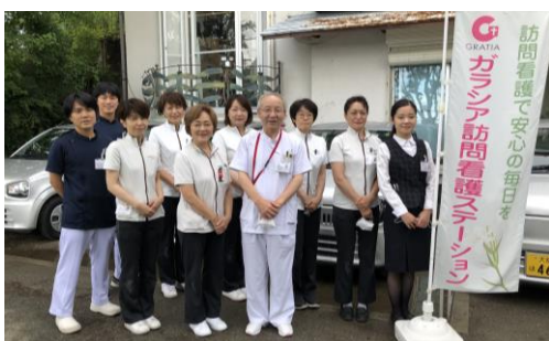
NS:5名 PT:2名 OT:1名