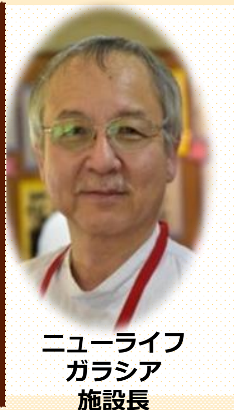
ニューライフ ガラシア 施設長

穏やかな最期を迎えるにはどうしたらよいのか。小児外科医として最先端の生体肝移植に携わり、子供たちの命を救うため東奔西走してきた医師は、ある日訪れた高齢者病棟で、死とはどのように迎えるべきかという難問にぶつかり、高齢者ケアへの道へ歩みだす。増え続ける認知症の人々のケア、地域包括ケアシステムの構築の問題。尊厳死のあり方……。時にはギターを弾いて患者たちと歌い、時には救えなかった命への悔し涙で酒を飲み干す。医師・医療・介護を志す人たちに贈る奮闘の記録